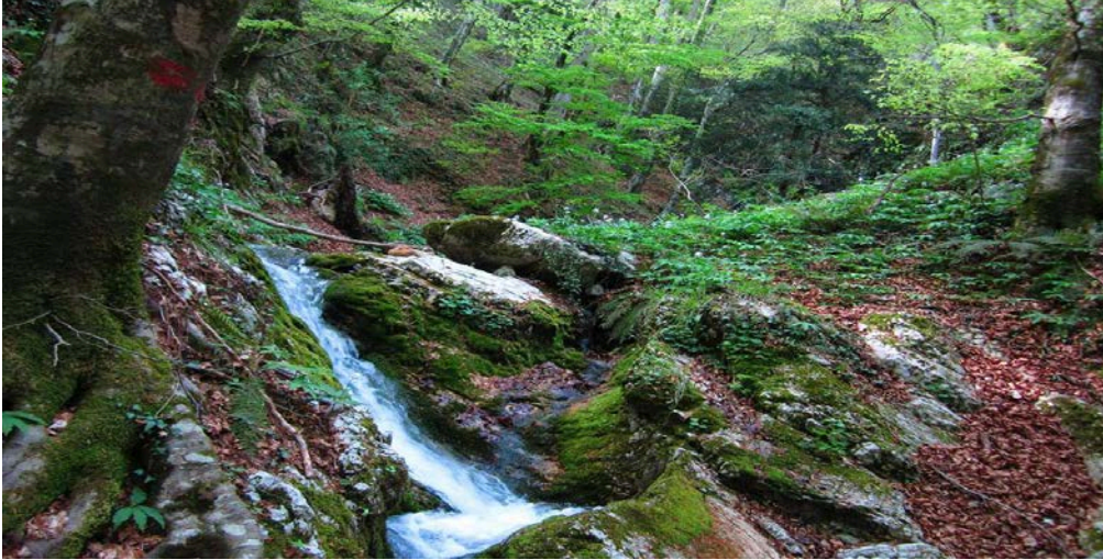
Piano di Assestamento Forestale (PAF) del Comune di Acerno (SA) vigenza 2015-2024

P.IVA 00552610651 - Via Rimembranza 8 - 84042 Acerno (SA) Tel. 089/9821211 - Fax 089/9821227 PEC protocollo@pec.comune.acerno.sa.it